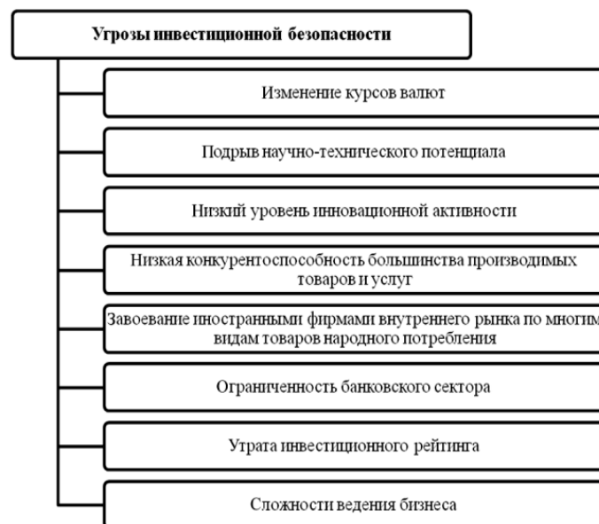
Рис.1. Угрозы инвестиционной безопасности

Снижают инвестиционную безопасность деструктивные факторы – такие как угрозы и инвестиционные проблемы. Угрозы оказывают менее разрушающее воздействие на безопасность, их возможно устранить простыми методами; в отличие от проблем, которые формировались годами или десятилетиями, они глубоко воздействуют на всю экономическую систему, нанося серьезный ущерб, поэтому способы их разрешения многосложны и постепенны [5].